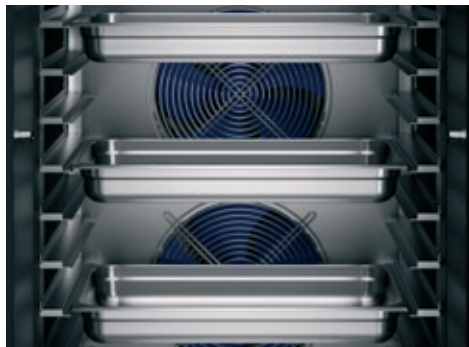
Tiheä johteikko auttaa säätämään johdevälin sopivaksi jäähdytettävälle tuotteelle. Kuvan johteet sopivat GN1/1-astioille ja EN 600x400 -leipomopelleille.