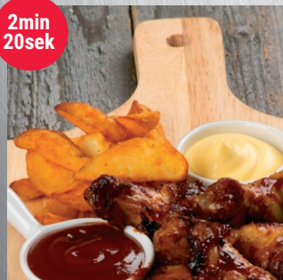
Kycklingvingar och klyftpotatis