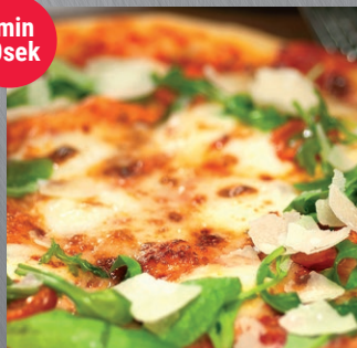
Kyld, förgräddad pizza med tunnt botten